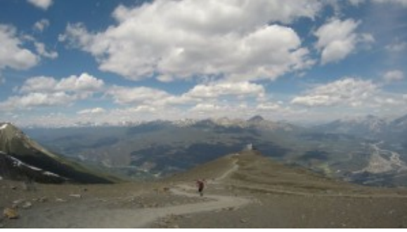
Whistlers – Sky Tram