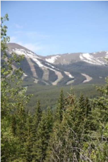
Ski Resort Nakiska