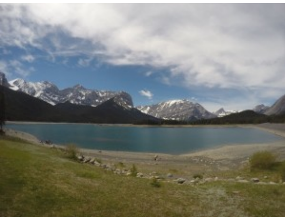
Upper Kananaskis Lake