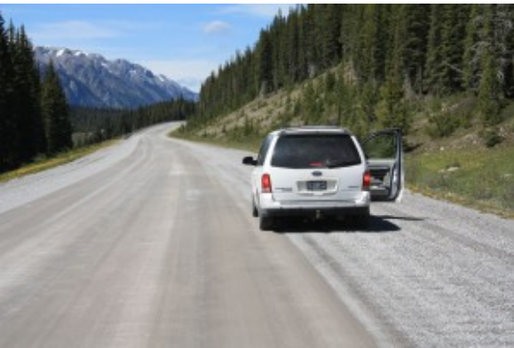
Backroad to Canmore