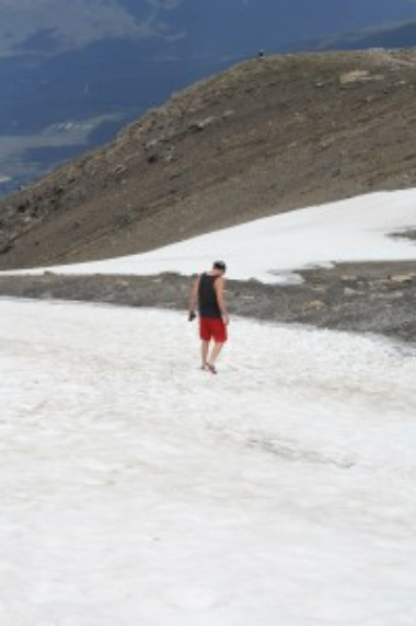
Whistlers – Sky Tram